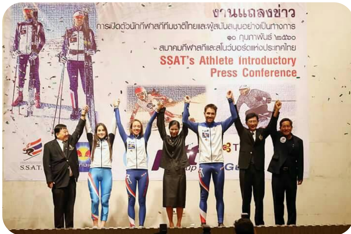
ที่ประชุม รับทราบ

ระเบียบวาระที่ ๒.๗ การสนับสนุนทางการเงินจากภาครัฐและเอกชน